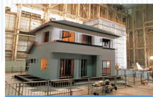
実大振動実験で震度7相当をクリア

「木の家に、確かな安心を約束したい。」 そんな願いをこめて生まれた、「テクノストラクチャーの家」。