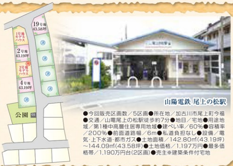
山陽電鉄 尾上の松駅

●今回販売区画数/5区画●所在地/加古川市尾上町今福 ●交通/山陽尾上の松駅徒歩約7分●地目/宅地●用途地 域/第1種中高層住居専用地域●建ぺい率/60%●容積率 /200%●前面道路幅/6m●私道負担なし●設備/暖 気・上下水道・都市ガス●土地面積/142.80㎡(43.19坪) ~144.09㎡(43.58坪)●土地価格/1,197万円●最多 価格帯/1,190万円台(2区画)●売主※建築条件付宅地