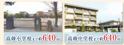
高砂小学校まで約 640m